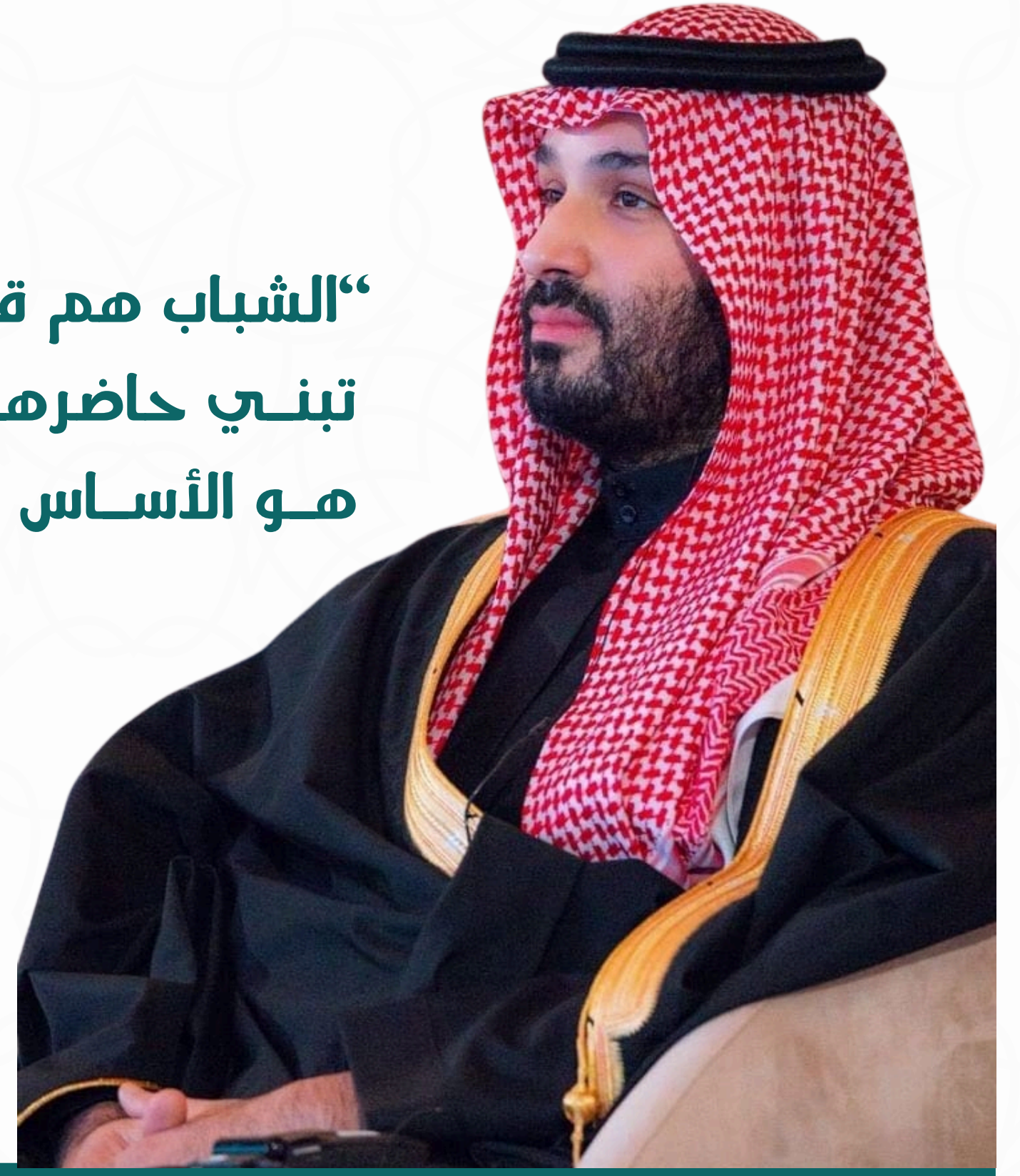
صاحب السمو الملكي الأمير محمد بن سلمان بن عبدالعزيز

“الشباب هم قاعدة كل البلدان، وهم حملة شعلتها والأيدي التي تبني حاضرها وقادة مستقبلها، فلذلك كان التركيز عليهم هو الأساس في أي حراك تنموي وخطط طموحة لنهضة الدول وعزها ورفعتها”